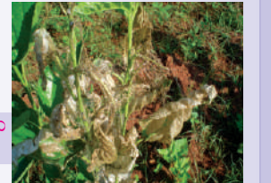
ಕಂಬಳಿ ಹುಳು ಬಾಧೆ