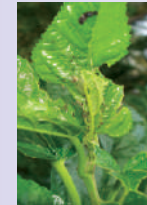
ಎಲೆ ಸುರುಳಿ ಕೀಟ ಬಾಧೆ

ಶಿಫಾರಸ್ಸು ಮಾಡಿರುವ ಪ್ರಮಾಣ: ಕೀಟನಾಶಕ ಸಿಂಪರಣೆಯ 5-6 ದಿನಗಳ ನಂತರ ಒಂದು ಎಕರೆಗೆ ಒಂದು ವಾರಕ್ಕೆ ಒಂದು ಕಾರ್ಡ್ ನಂತೆ 4 ವಾರಗಳ ಕಾಲ ಇವನ್ನು ಸತತವಾಗಿ ಉಪಯೋಗಿಸಬೇಕು (ಜುಲೈ ನಿಂದ ಡಿಸೆಂಬರ್ ತನಕ ಕಡ್ಡಾಯವಾಗಿ ಪ್ರತೀ ಬೆಳೆಯಲ್ಲಿ)