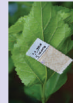
ಟ್ರೈಕೋ ಕಾರ್ಡ್ ಬಳಸುವ ವಿಧಾನ