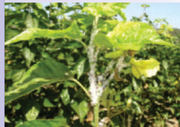
ಪಪ್ಪಾಯಿ ಬೂಸ್ಟುತಿಗಣೆ ಹಾನಿಯ ಲಕ್ಷಣ