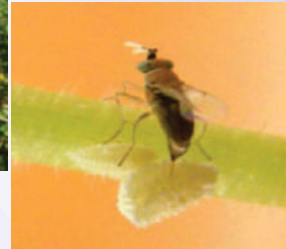
ಪಪ್ಪಾಯಿ ಬೂಸ್ಟು ತಿಗಣೆ ದೇಹದೊಳಗೆ ಮೊಟ್ಟೆ ಇಡುತ್ತಿರುವ ಆಸಿರೋಫ್ಲೇಗಸ್

ಬಿಡುಗಡೆಗೊಳಿಸುವ ರೀತಿ: ಆಸಿರೋಫ್ಲೇಗಸ್ ಪರತಂತ್ರ ಜೀವಿಗಳಿರುವ ಡಬ್ಬಿಯ ಮುಚ್ಚಳವನ್ನು ತೆಗೆದು ತೋಟದ ಒಳಗೆ ಅಡ್ಡಾಡುತ್ತಾ ಪಪ್ಪಾಯಿ ಬೂಸ್ಟು ತಿಗಣೆ ಇರುವ ರೆಂಬೆಗಳ ಮೇಲೆ ಅವು ಬೀಳುವಂತೆ ಬಿಡಬೇಕು.