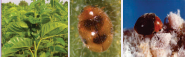
ಬೂಸ್ಟು ತಿಗಣೆ ಹಾನಿಯ ಲಕ್ಷಣ

ಸ್ಮಿಮ್ಮಸ್ ಕಾಕ್ಸಿವೋರ ಮತ್ತು ಕ್ರಿಪ್ಟೋಲಿಮಸ್ ಮಾಂಟ್ರೋಜೈರಿ ಎಂಬ ಎರಡು ಜಾತಿಯ ಗುಲಗಂಜಿ ಹುಳುಗಳು ಬೂಸ್ಟು ತಿಗಣೆಯನ್ನು ಭಕ್ಷಿಸಿ ನಾಶಮಾಡುವ ಕಾರ್ಯದಲ್ಲಿ ಪ್ರಮುಖ ಪಾತ್ರ ವಹಿಸುತ್ತವೆ. ಹಾಗೆಯೇ ಇವು ಬೂಸ್ಟು ತಿಗಣೆಗಳ ಮಧ್ಯದಲ್ಲಿ ತಮ್ಮ ಮೊಟ್ಟೆಗಳನ್ನೂ ಸಹ ಇಡುತ್ತವೆ. ಈ ಮೊಟ್ಟೆಗಳಿಂದ